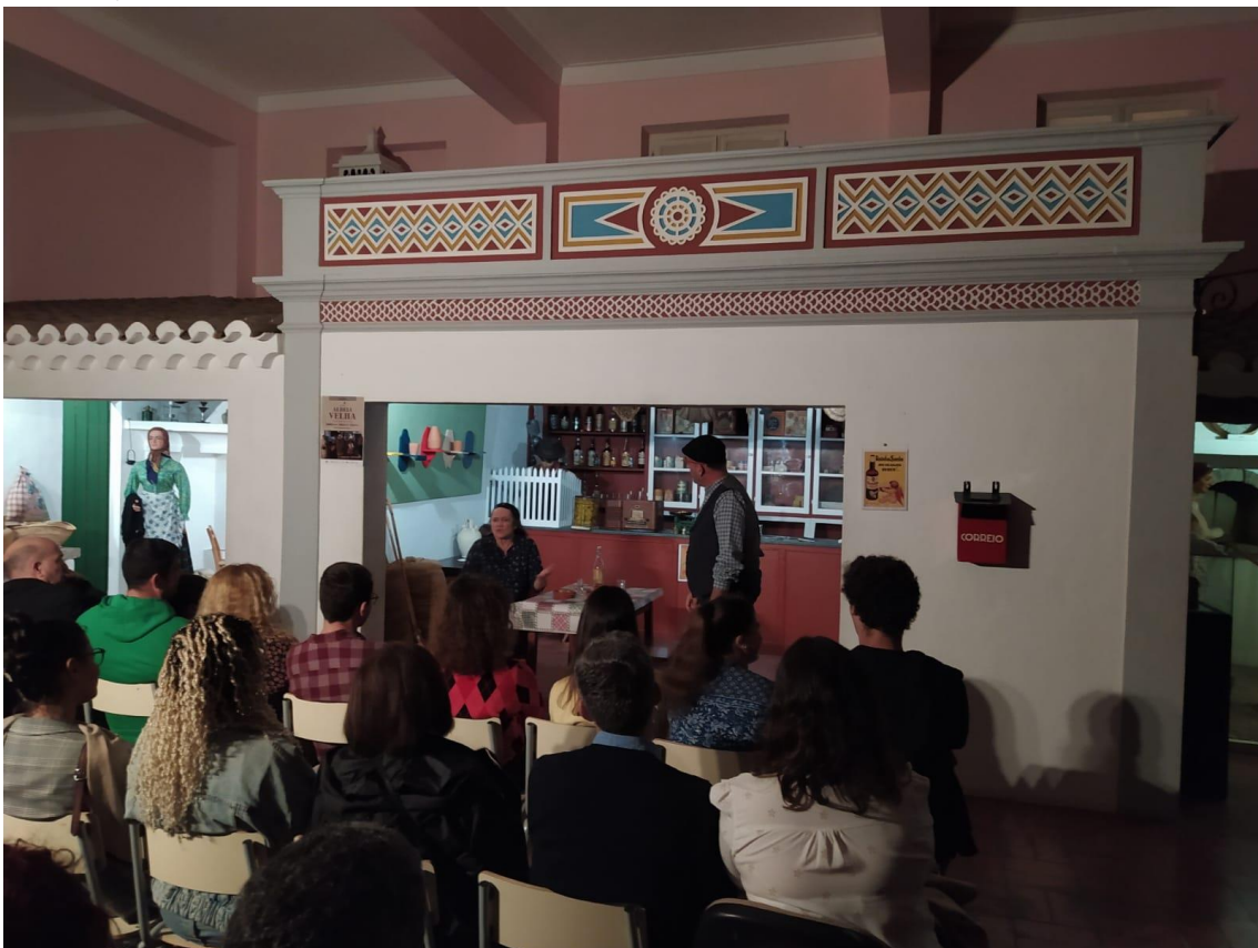
- Aldeia Velha , recriação do quotidiano dos anos 60 nas aldeias algarvias no Museu Regional do Algarve;