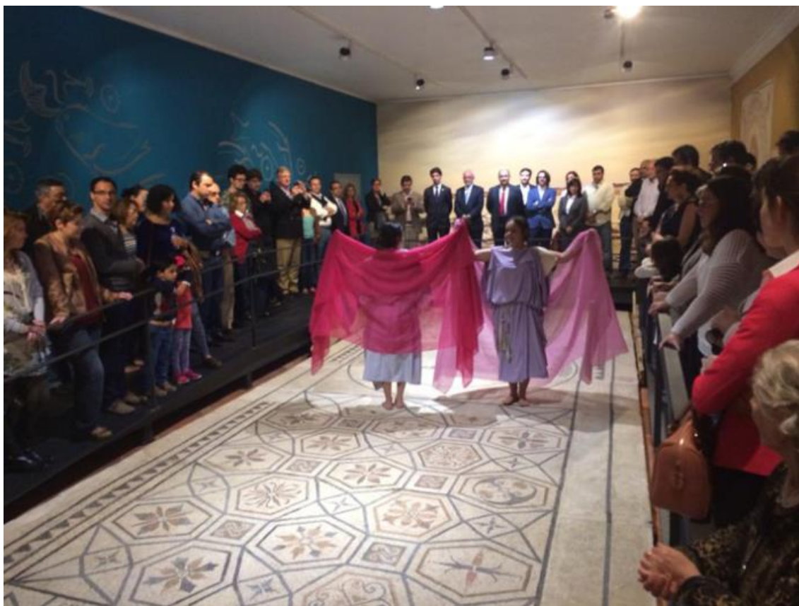
- Uma questão de vírgulas , Criação a propósito da atribuição do título de tesouro nacional ao Mosaico Romano do Deus Oceano, no Museu Municipal de Faro (MMF);