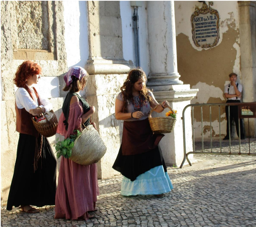
- Segredos de Aquino , criação de um momento teatral junto ao Arco da Vila, onde está a imagem de S. Tomás de Aquino.