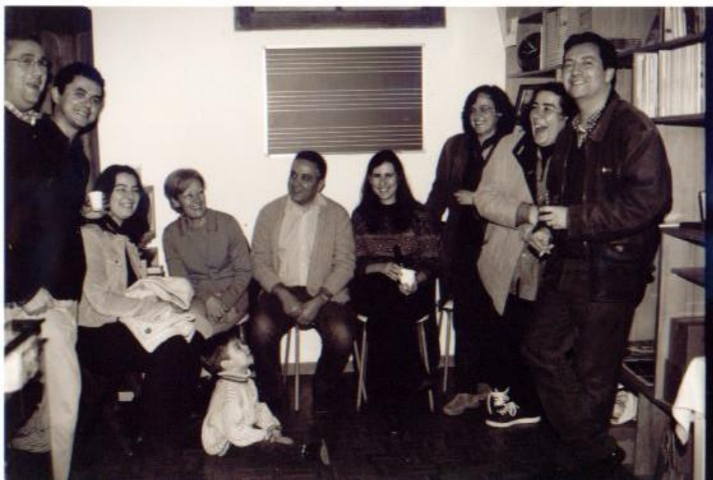
Os sócios fundadores

A Associação Cultural Música XXI, criada em 7 de Fevereiro de 2000 surgiu da urgência do encontro entre amantes da música e da cultura, no sentido de unirem esforços em prol de um bem maior: a ARTE. Antigamente, a música (mousiké) tinha um sentido muito mais amplo do que é dado pelo significado moderno do termo. Ela significava todo o vasto domínio das musas. A poesia, o drama, a história, a oratória, a ciência, eram incluídas na extensão do termo. Ao denominar-se “Música XXI” foi, também, com esse intuito que esta Associação, sedeadada em Faro, pretendeu trazer para o atual século o espírito dos nossos ancestrais amantes da cultura.