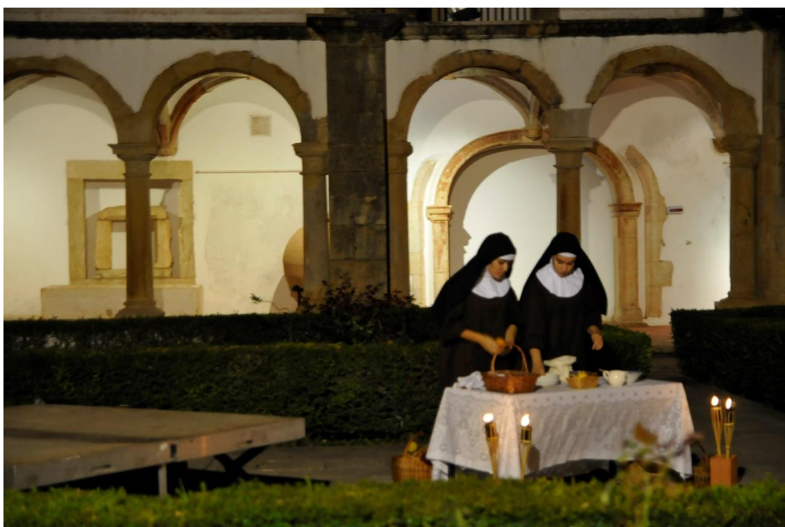
- Santas barrigas de freiras , criação recriando o quotidiano das freiras clarissas no MMF;